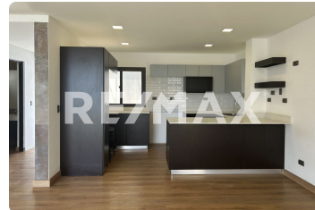
Property photo 4