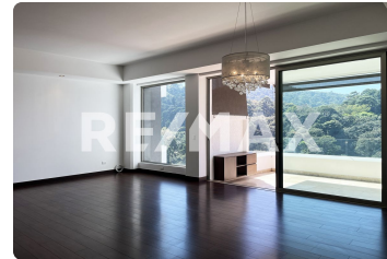
Property photo 4